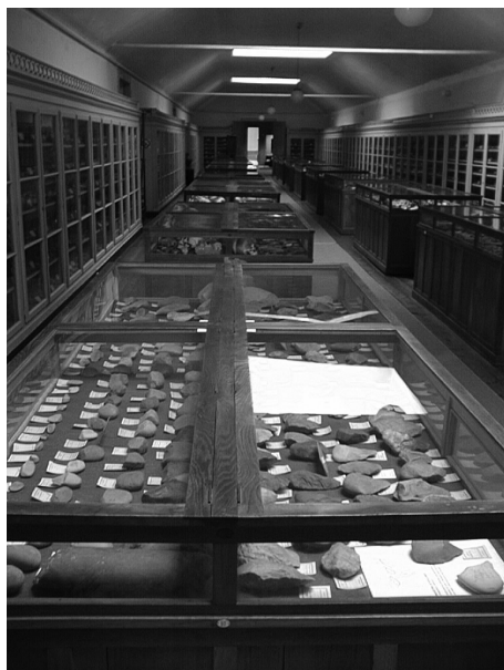
Fig. 3. Detalhe das vitrinas do Paleolítico antes da intervenção de 2002.