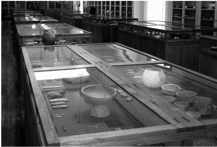
Fig. 6. Detalhe da nova apresentação. F. Nuno Pires, 2009.

A montante da selecção apresentada esteve a realização, nos anos anteriores, de um trabalho sistemático de inventário e documentação, ainda longe de concluído, e de intervenção curativa e/ou restauro, nas peças que inspiravam maior preocupação ou que se tinha em vista para eventual utilização na exposição 39 . A revisão científica do programa de intervenção foi coordenada pelo Prof. Doutor J. L. Cardoso, colaborador habitual dos Serviços e estudioso destas colecções.