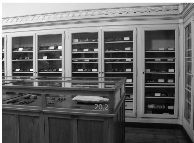
Fig. 5. Contraste de elementos entre os elementos museográficos oitocentistas e a intervenção havida. Foto P. de Sousa, 2003.

Quanto ao mobiliário, na impossibilidade prática de o substituir ou de adquirir outro tipo elementos, optou-se pelo seu restauro, trabalho que decorreu em paralelo com a preparação da nova apresentação, no âmbito da parceria estabelecida com uma entidade de formação profissional 38 .