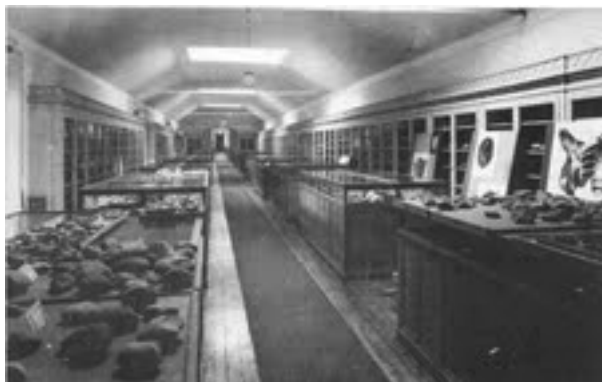
Fig. 2. Detalhe dos expositores ambivalentes equipados com gavetas normalizadas, intermutáveis.

Este número, e a disposição em duas filas paralelas, mantiveram-se até a actualidade 21 .