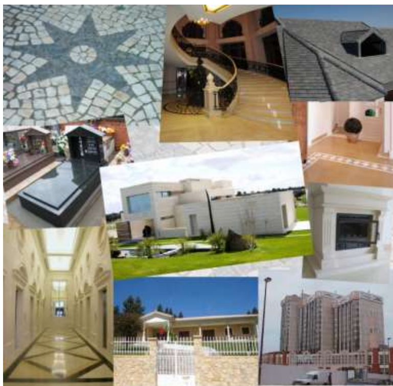
Figura 1- Exemplos de aplicação das Rochas Ornamentais

As rochas ornamentais, também vulgarmente designadas por Pedras Dimensionais (Bowles, 1939; Currier, 1960 e Barton, 1968), ou Pedras Naturais, podem ser definidas como a matéria-prima de origem mineral utilizada como material de construção com funções essencialmente decorativas. Cabem neste âmbito todos os tipos rochosos extraídos e processados segundo as mais variadas dimensões e formas, desde os pequenos cubos utilizados no calcetamento de ruas, até às finas placas de rochas xistosas usadas em revestimentos, passando, como é óbvio, pelos grandes blocos destinados à obtenção de chapas para revestimentos diversos, estatuária, pedras tumulares, etc.