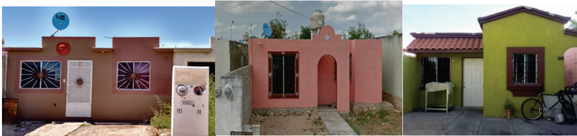
Figura 1. Vivienda en Ciudad Juárez, Chihuahua México. Figura 2. Vivienda en Mérida, Yucatán, México. Figura 3. Vivienda en Mexicali, Baja California Norte, México.

que tiene impacto en las posibilidades de resolver todas sus necesidades con sólo el 70% de ese ingreso, para una familia de 4 integrantes, aproximadamente.