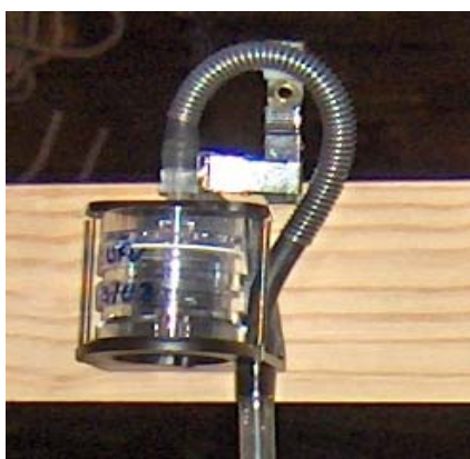
Fig. 1 - Fracção total em cassetes de PVC