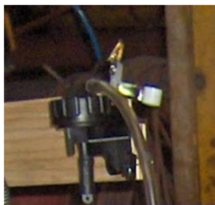
Fig. 2 - Fracção respirável em ciclone Higgins-Dewell - HD