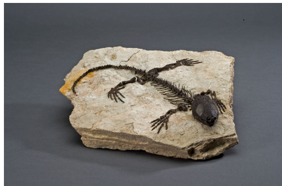
Fig. 3: Captorhinus aguti Cope. Formação Arroyo, Pérmico inferior. Lawton, Oklahoma. Inv. MHNS.02.6354. Foto: MHNS/J.F., 2005.

Neste sentido, temos vindo a organizá-la seguindo o “modelo clássico” de separação entre vertebrados, invertebrados e plantas, sendo estes grupos organizados de acordo com a sua posição taxonómica, esquema consolidado na própria organização da reserva museológica 5 [9].