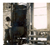
Mina de Ferragudo, 1945 (arq. LNEG).