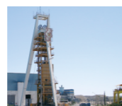
Poço de Santa Bárbara (mina de Neves Corvo, 700m).