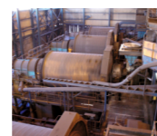
Moagem de minério, lavaria de Neves Corvo.