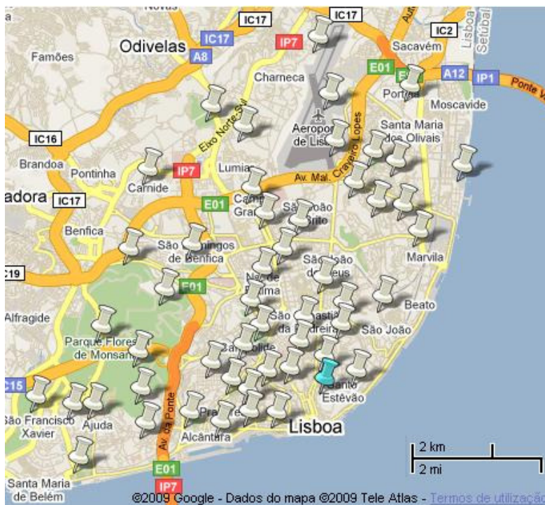
Fig. 3. Carta de amostragem de poeiras.

Um total de 66 amostras de poeira foi colhido em 51 pontos de amostragem (Fig.3) que incluíram jardins públicos, recreios escolares e parques infantis. Neste estudo foi seleccionada para análise química e mineralógica a fracção <math><500\ \mu\text{m}</math> porque inclui as \text{PM}_{10} e \text{PM}_{2,5} , e partículas que tanto podem ser inaladas como facilmente aderem às mãos sendo passíveis de serem ingeridas, especialmente por crianças.