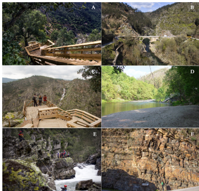
Figura 1. Passadiços do Paiva (a), estrutura em madeira com 8,3 km de extensão na margem esquerda do rio Paiva, entre Areinho e Espiunca e geossítios Garganta do Paiva (b), Cascata das Aguieiras (c), Vau (d), Gola do Salto (e) e Falha da Espiunca (f), observáveis ao longo do percurso dos Passadiços.

A existência de pontes pedonais sobre o rio Paiva, para além do seu valor funcional e da atratividade que proporcionam, favorece a observação dos geossítios. A ponte suspensa do Vau, (Figura 3e) que liga as margens do rio Paiva onde já houve barqueiros a assegurar tal tarefa, permite uma melhor visibilidade sobre o geossítio Vau. A 516 Arouca – Ponte Suspensa (Figura 3f), inaugurada em 2021, permite a visualização arrojadada do geossítio Cascata das Aguieiras e uma ampla