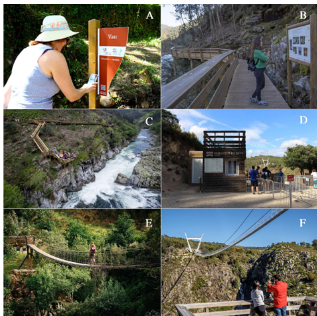
Figura 3. Exemplos de instrumentos e infraestruturas de valorização e de apoio à visitação dos Passadiços do Paiva: poste de localização e com código QR no geossítio Vau (a); painel informativo e interpretativo (b); plataforma de observação do geossítio Gola do Salto (c); pórtico de entrada com bilheteira (Areinho) (d); ponte pedonal suspensa do Vau (e); 516 Arouca suspension footbridge (f).

Ao longo de todo o ano desenvolvem-se nos Passadiços do Paiva atividades de carácter turístico e educativo, tornando esta infraestrutura um Equipamento de Educação Ambiental (Marques, 2018). No âmbito dos Programas Educativos do Arouca Geopark são propostas cinco saídas de campo nos Passadiços do Paiva, dirigidas para os alunos do 2º Ciclo de Ensino Básico ao Secundário e desenvolvidas nas áreas da geologia, da biodiversidade, da geografia e do turismo. As saídas de campo envolveram, até ao momento, 3035 alunos e professores e realizam-se em grupos máximos de 30 participantes. Todas as visitas realizadas na ‘516 Arouca’ são guiadas, por forma a garantir a transmissão de conhecimentos nas áreas da geoconservação e património geológico do AGMU. São também realizadas frequentemente visitas interpretadas e/ou científicas, com um máximo de 30 participantes, das quais se destacam as atividades no âmbito da programação Rota dos Geossítios Interpretada ou do programa Ciência Viva no Verão que, no seu conjunto, mobilizaram já mais de 250 participantes.