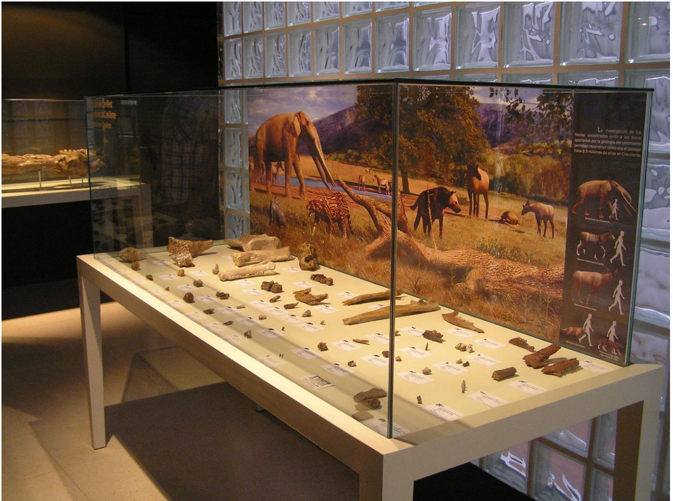
Figura 2. Fósiles del yacimiento CR2 en la exposición actual del Museo Paleontológico de Elche (Alicante, España).

“Entre mastodontes y pequeños roedores” sería el área dedicada a un yacimiento de la provincia de Alicante conocido internacionalmente por la presencia de restos fósiles de mamíferos, “Crevillente 2”, en el término municipal de Crevillent. Se trata de un yacimiento del Mioceno superior, de hace aproximadamente