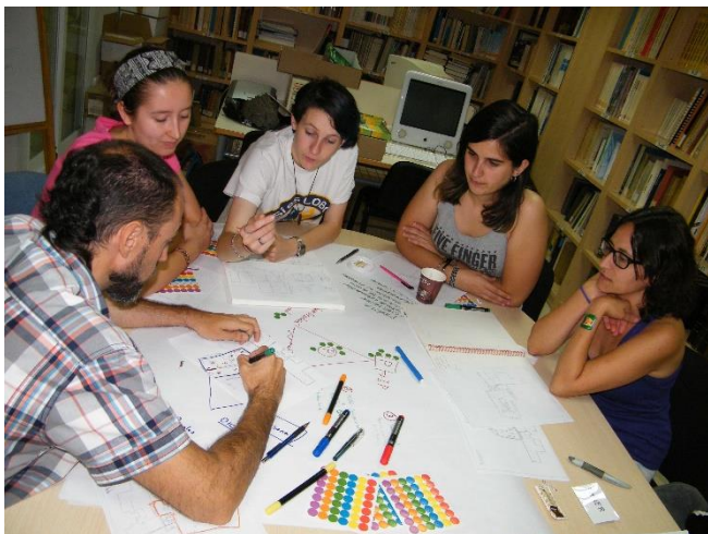
Figura 1. Equipo durante la puesta en común y diseño de la propuesta museográfica.

Así pues, el objetivo de este trabajo es mostrar la metodología utilizada para el trabajo con el alumnado de prácticas en el desarrollo de una propuesta museográfica para la planta superior del MUPE, evaluando los resultados obtenidos y extrayendo unas conclusiones que nos permitan confirmar o rechazar la utilidad de nuestra propuesta de trabajo y del tiempo y recursos implicados en ella.