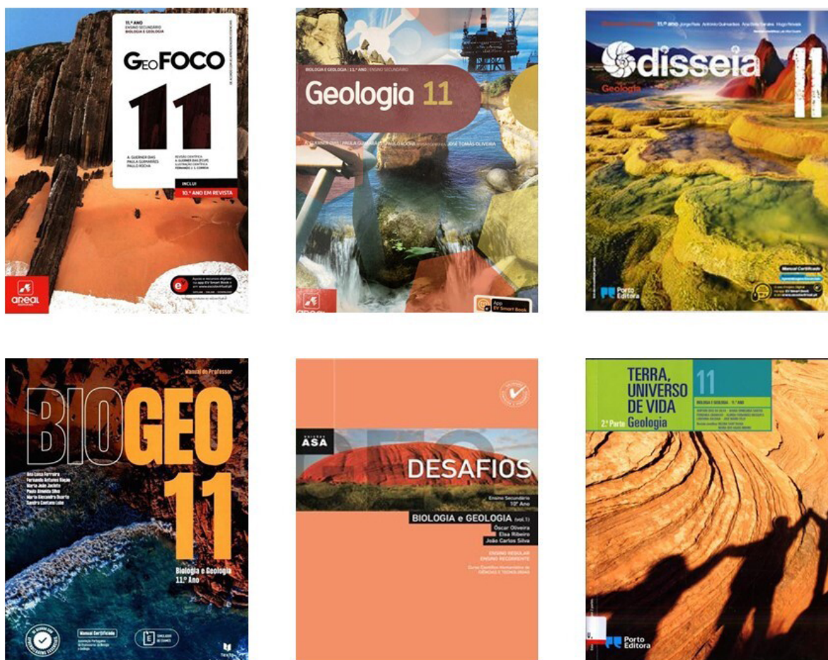
Figura 1. Manuais escolares do 11.º ano de escolaridade analisados.