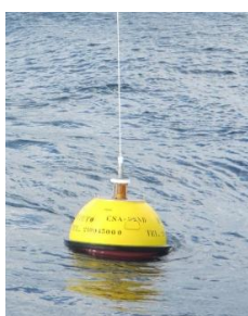
Figura 3 – Boia Ondógrafo [1, 2]

A energia das ondas tem vindo a ser desenvolvida com ferramentas técnico-científicas adequadas desde a década de 70 do século XX. Ainda assim, é usualmente aceite que, atualmente, nenhum sistema de conversão de energia das ondas (CEO) demonstrou suficiente maturidade técnica para se impor no mercado das energias offshore . Neste projeto pretende-se caracterizar com detalhe o potencial da energia das ondas, bem como identificar os locais da costa Portuguesa que mais se adequam à sua instalação, tendo como base o cálculo do LCOE (Custo Normalizado da Energia) para um conjunto de sistemas de conversão de energia das ondas.