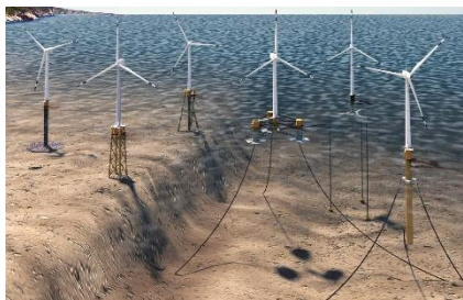
Figura 1 – Tecnologia eólica offshore

O projeto OffshorePlan - Planeamento da instalação de energias renováveis offshore em Portugal – financiado pelo programa POSEUR (Programa Operacional Sustentabilidade e Eficiência no Uso de Recursos) do Portugal 2020 – surgiu na sequência da identificação de