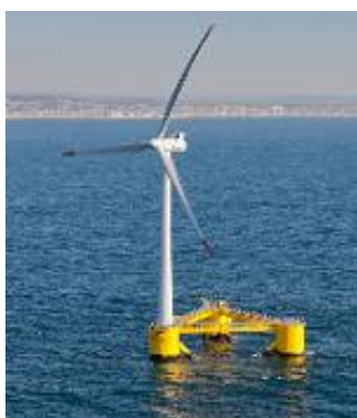
Figura 4 – WindFloat - Principle Power

Um dos objetivos deste projeto consiste no refinamento e validação do Atlas do Potencial Eólico Offshore de Portugal continental produzido pelo LNEG em 2006 [3].