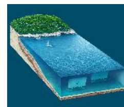
Figura 2 – Tecnologia de energia das ondas

existência de elevado recurso energético, cujo estudo tem vindo a ser efetuado nos últimos anos. Não obstante esses estudos persistem várias barreiras a ultrapassar para a disseminação das tecnologias de energias renováveis com maior aplicabilidade em Portugal – eólica offshore e ondas – as quais se prendem, essencialmente, com: i) mapeamento do recurso energético com precisão e sua validação experimental; ii) escassez de serviços e meios para ações de instalação e manutenção destes sistemas; iii) capacidade de receção da rede elétrica; e iv) impacto socioeconómico, entre outras. No projeto OffshorePlan está em desenvolvimento uma metodologia de planeamento da instalação de sistemas de energias renováveis marinhas – eólica offshore e ondas – a qual permitirá selecionar e hierarquizar a valência de futuras instalações, tendo em conta a sua evolução temporal e variabilidade espacial.