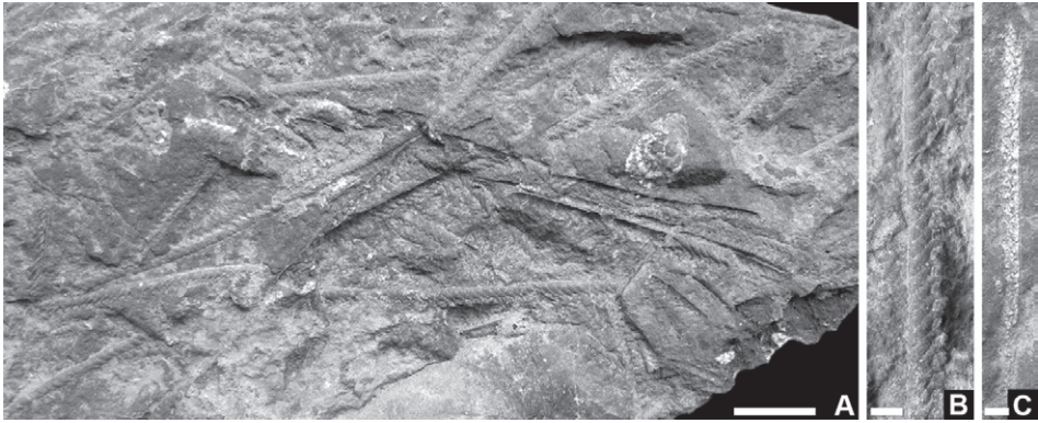
Fig. 3. Monograptus sp. (fragmentos mesio-distales de rabdosomas con tecas ganchudas). Moldes internos en la caliza del Wenlock (?) del Puerto Calatraveño (A), con detalle de uno de los ejemplares (B) y otro con relleno espático (C). Escalas gráficas: A, 10 mm; B-C, 2 mm.

trabajo es una contribución al proyecto 591 del PICG (IUGS-UNESCO) y está dedicado a nuestro colega “cámbrico” Dr. Antonio Perejón, con motivo de su jubilación.