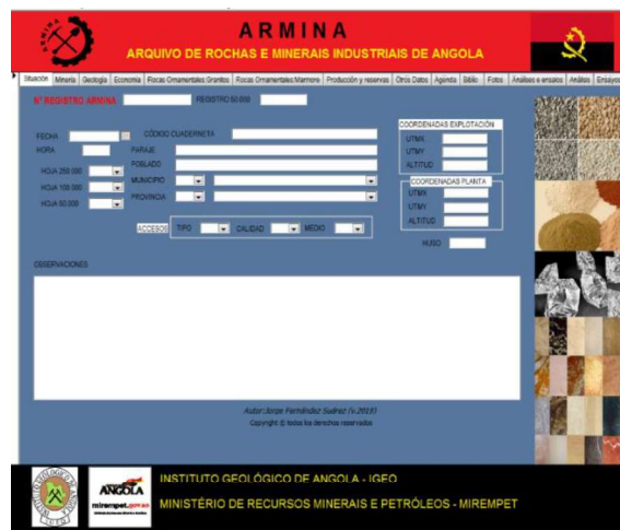
FIGURA 2. Una de las pestañas de consulta del formulario de la base de datos ARMINA. Sirva como modelo de distribución y aspecto de una de las pestañas de la base de datos (BBDD).

La Base de Datos de Recursos Minerales, denominada “Arquivo de Rochas e Minerais Industriais de Angola” (ARMINA) integra la información geológico-minera sobre indicios y explotaciones de rocas y minerales de manera que toda la información esté disponible de manera fácil. La base de datos se distribuye en 11 pestañas de carga y acceso a la información en una sencilla interfaz de visualización (Fig. 2).