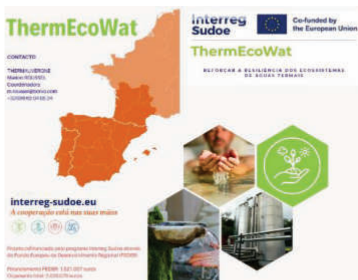
Figura 3 – Extrato do Flyer em português do projeto ThermEcoWat (2024).

Entre as atividades transversais colaborativas destacam-se a comunicação, cuja estratégia, liderada pela Thermauverne, consiste numa divulgação eficaz dos objetivos do projeto, progresso e resultados entre os vários intervenientes, através de infográficos tecnicamente acessíveis, vídeos com entrevistas, flyers nos 3 idiomas do projeto (Fig. 3) e reforçando simultaneamente a visibilidade e o alcance do projeto a nível local, nacional e internacional (ThermEcoWat, 2023).