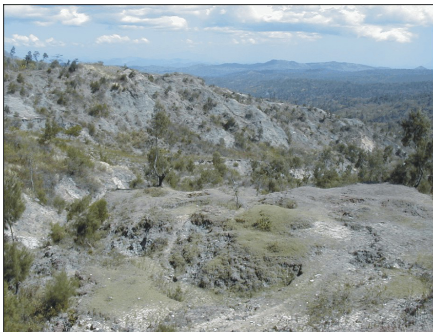
Figura 2. Aspecto dos afloramentos do Complexo Argiloso na área de Venilale.

Outros elementos clásticos incluem fragmentos de xisto predominantemente argiloso, provavelmente da formação Wai Luli (Triássico superior - Jurássico médio) e mais raramente calcários com crinóides ( formação Maubisse ) do Pérmico. A morfologia dos litoclastos é também predominantemente angulosa mas ocorrem elementos com grau de arredondamento elevado.