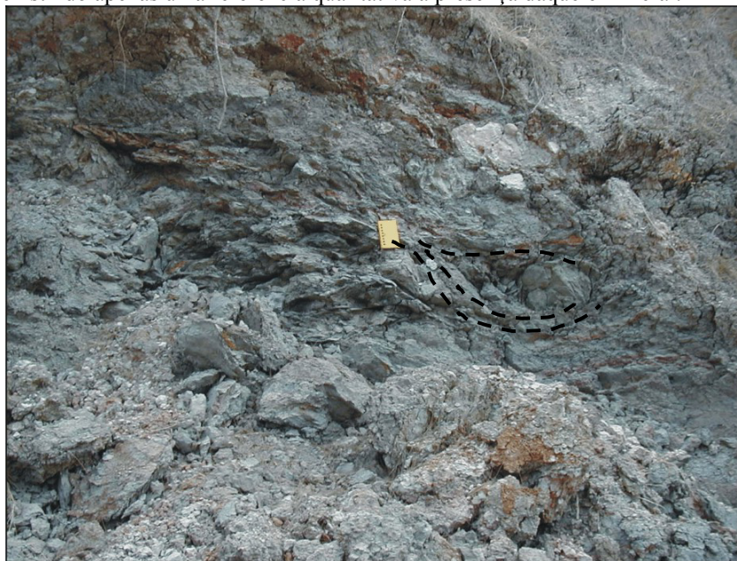
Figura 3. Pormenor de nível de argila verde, escamosa, com variações de cor para avermelhado (Amostra Ven2). Notam-se também linhas de fluxo envolvendo o pequeno bloco arredondado à direita.

observados no que respeita à montmorilonite, desconhecemos as metodologias usadas pelos autores citados, já que não são referidas, existindo apenas uma referência qualitativa à presença daquele mineral.