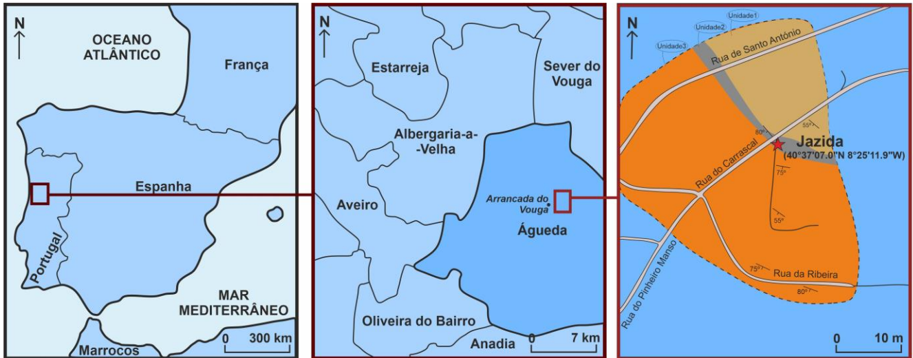
Figura 1. Localização geográfica e esboço geológico do afloramento em estudo. Unidade 1, metassiltitos intercalados com arenitos esbranquiçados; Unidade 2, metargilitos escuros; Unidade 3, metarenitos impuros micáceos amarelados.

Figure 1. Geographic location and geological sketch of the studied outcrop. Unit 1, siltstones and sandstones; Unit 2, dark mudstones; Unit 3, yellow micaceous impure sandstones.