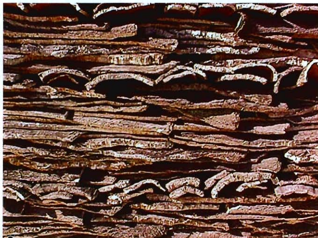
Pranchas de cortiça em pilha aguardando cozedura

Esta rede está aberta a consumidores dos produtos corticeiros e a fornecedores diversos, proporcionando um aumento da proximidade e, portanto, o levantamento de questões, sugestões, exigências etc. que proporcionarão/dinamizarão uma melhoria no setor através do aumento da competitividade e da produtividade.